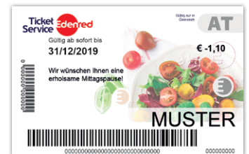
Ticket Restaurant® Karte